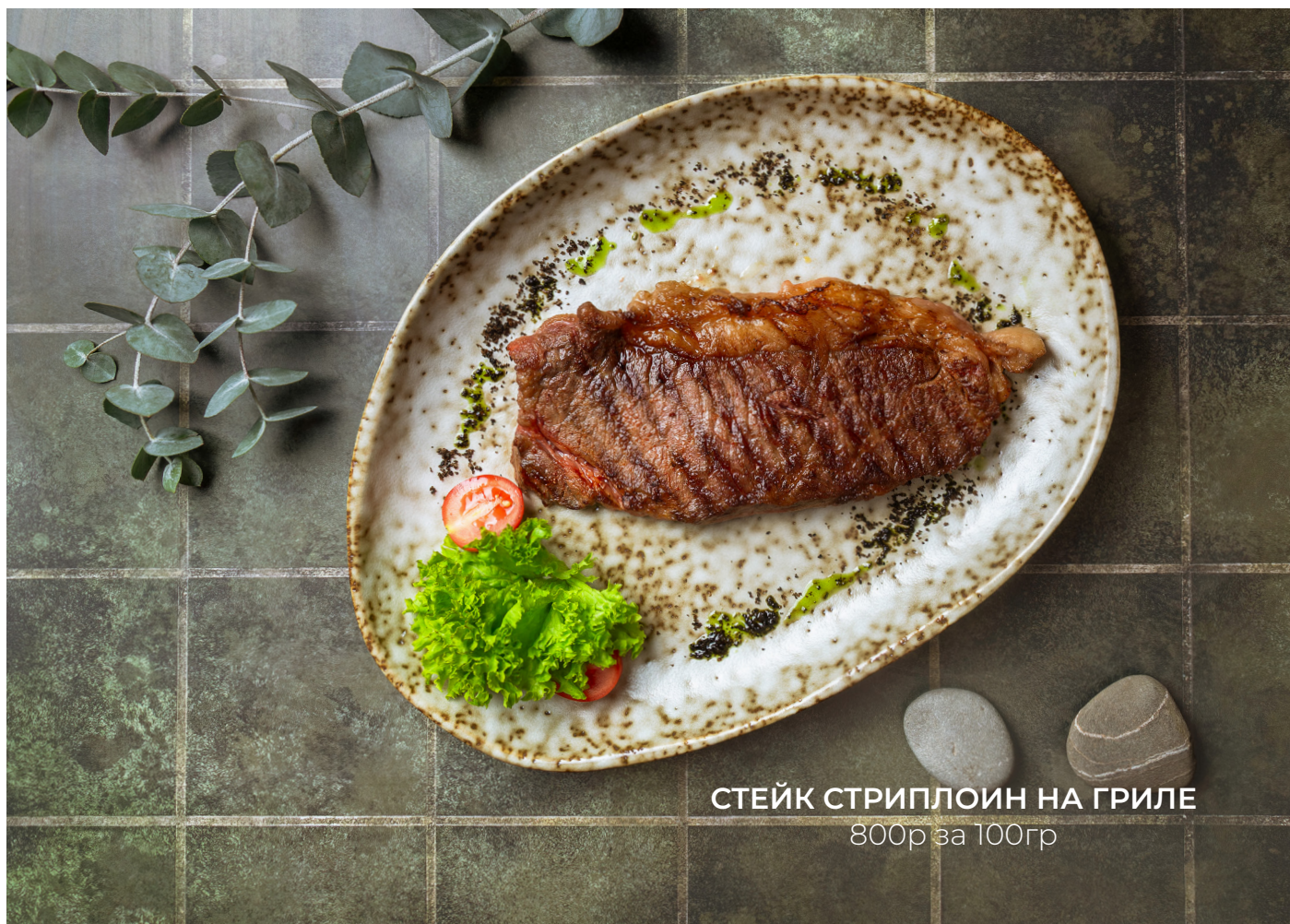
СТЕЙК СТРИПЛОИН НА ГРИЛЕ