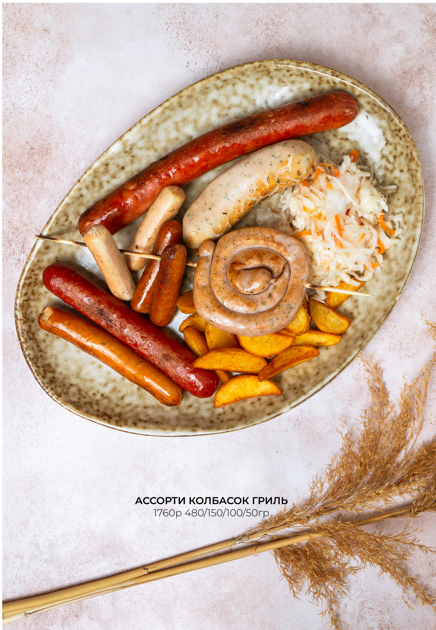
АССОРТИ КОЛБАСОК ГРИЛЬ 1760р 480/150/100/50гр