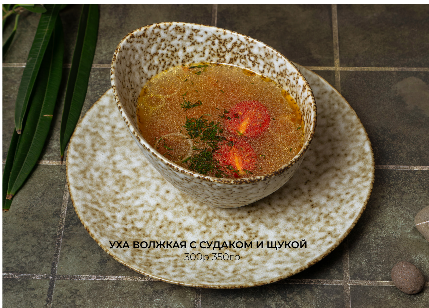
УХА ВОЛЖКАЯ С СУДАКОМ И ЩУКОЙ 300р 350гр