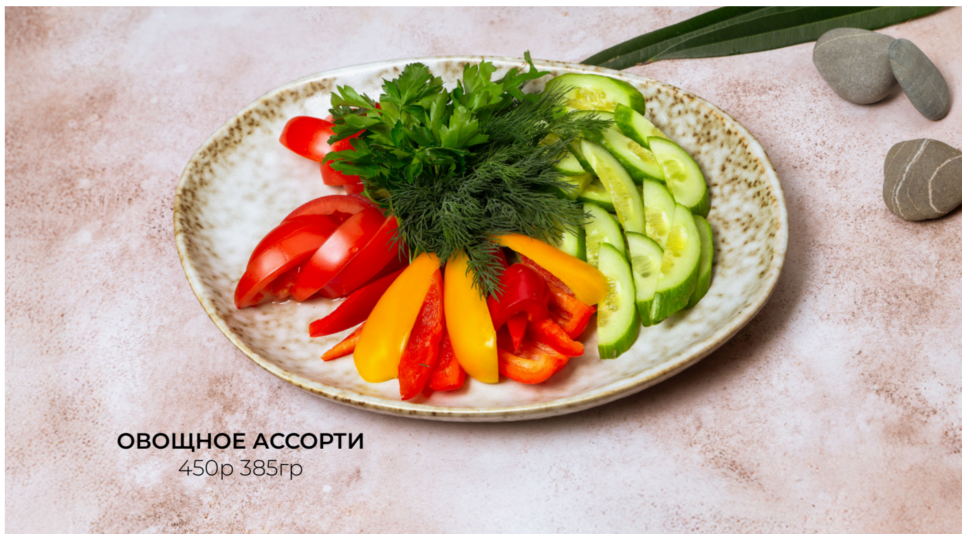
ОВОЩНОЕ АССОРТИ 450р 385гр