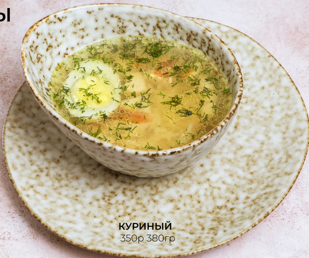
КУРИНЫЙ 350р 380гр