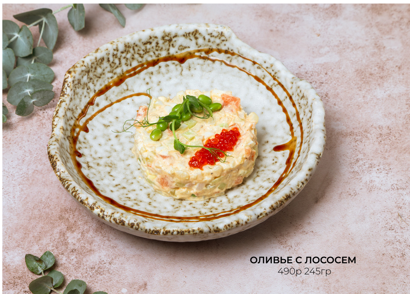
ОЛИВЬЕ С ЛОСОСЕМ 490р 245гр