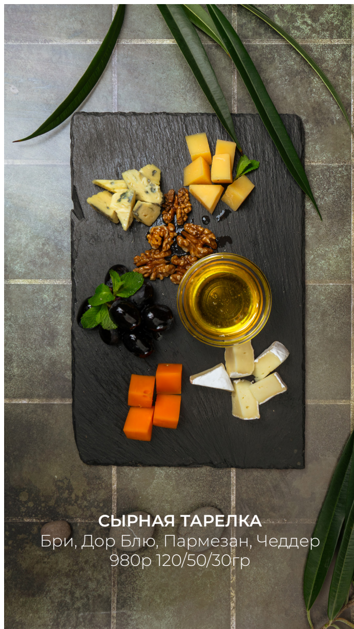
СЫРНАЯ ТАРЕЛКА Бри, Дор Блю, Пармезан, Чеддер 980р 120/50/30гр