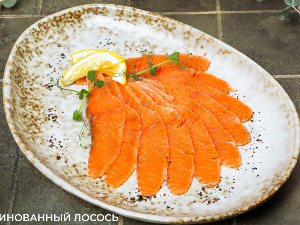
МАРИНОВАННЫЙ ЛОСОСЬ 1200р 100/20гр