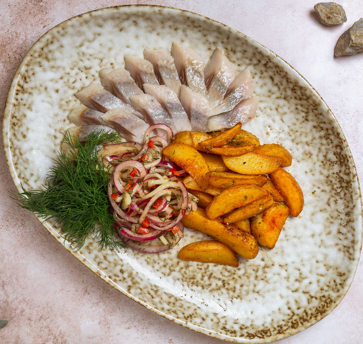
ФИЛЕ СЕЛЬДИ С КАРТОФЕЛЕМ И ЛУКОМ 480p 100/100/30гр