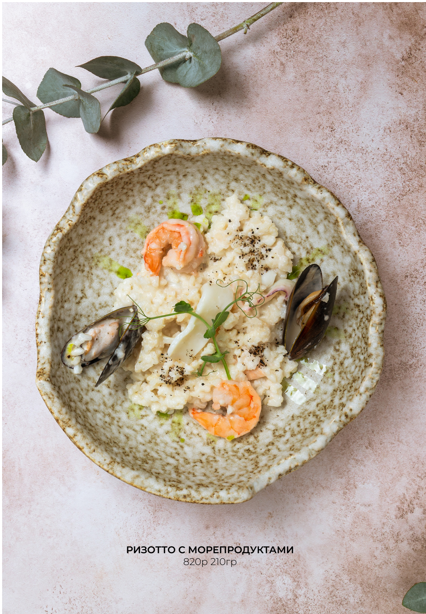
РИЗОТТО С МОРЕПРОДУКТАМИ 820р 210гр