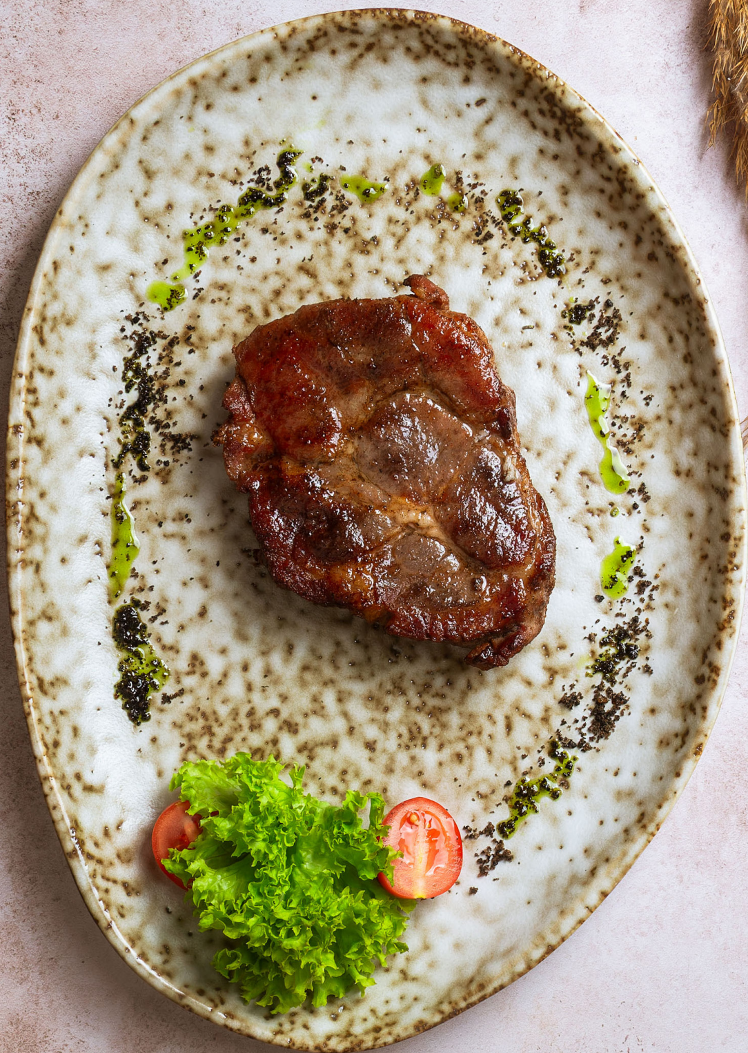
СВИНАЯ ШЕЯ НА ГРИЛЕ 250р за 100гр