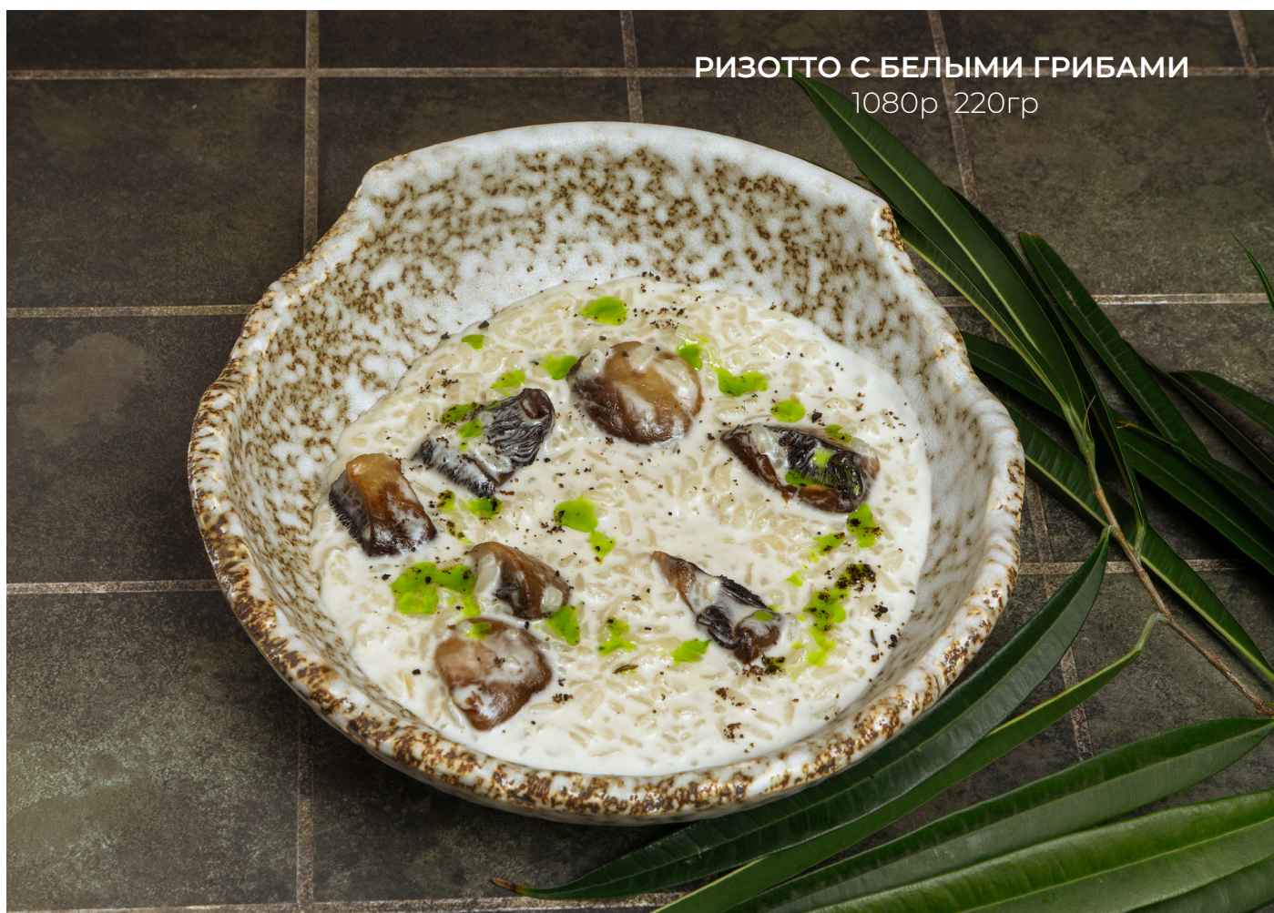
РИЗОТТО С БЕЛЫМИ ГРИБАМИ 1080р 220гр