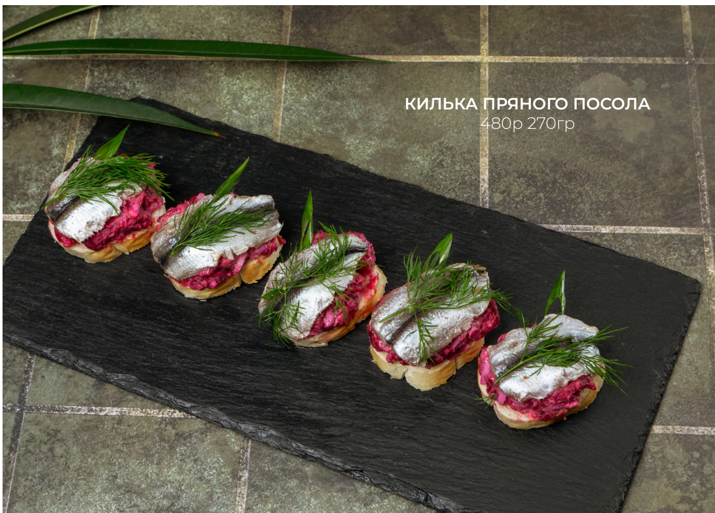
КИЛЬКА ПРЯНОГО ПОСОЛА 480р 270гр