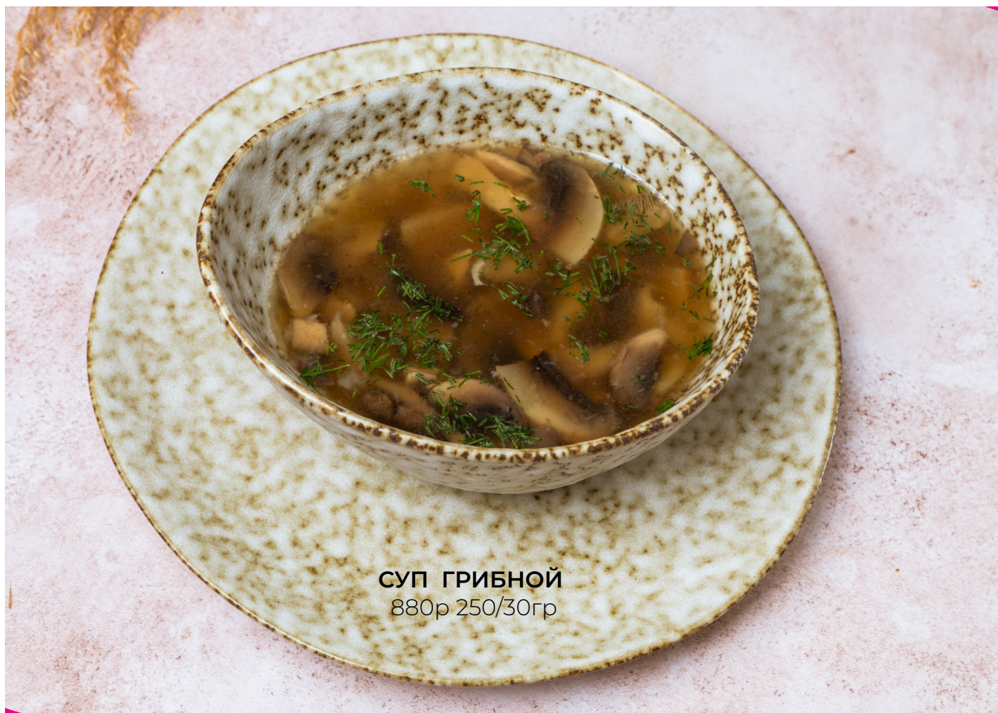
СУП ГРИБНОЙ 880р 250/30гр