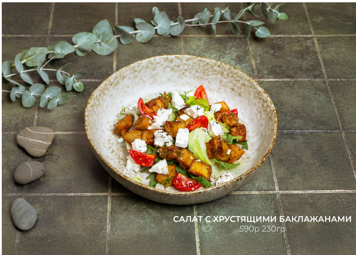
САЛАТ С ХРУСТЯЩИМИ БАКЛАЖАНАМИ 590р 230гр