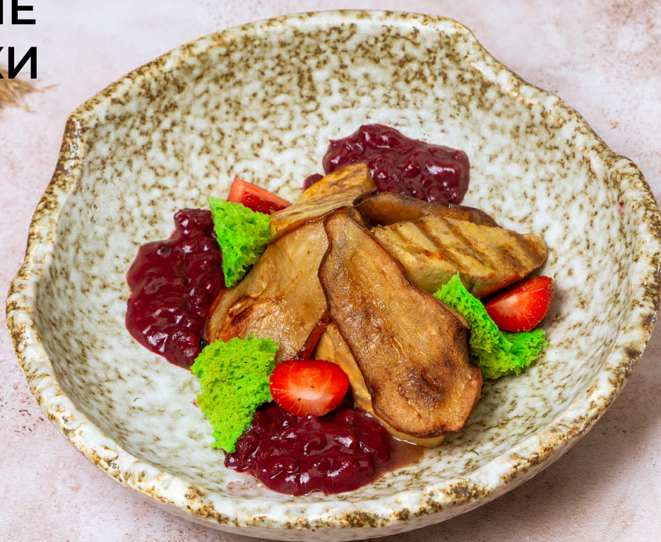
ФУА-ГРА С МАЛИНОВЫМ СОУСОМ И ГРУШЕВЫМИ ЧИПСАМИ 4200р 175/60/20/10гр