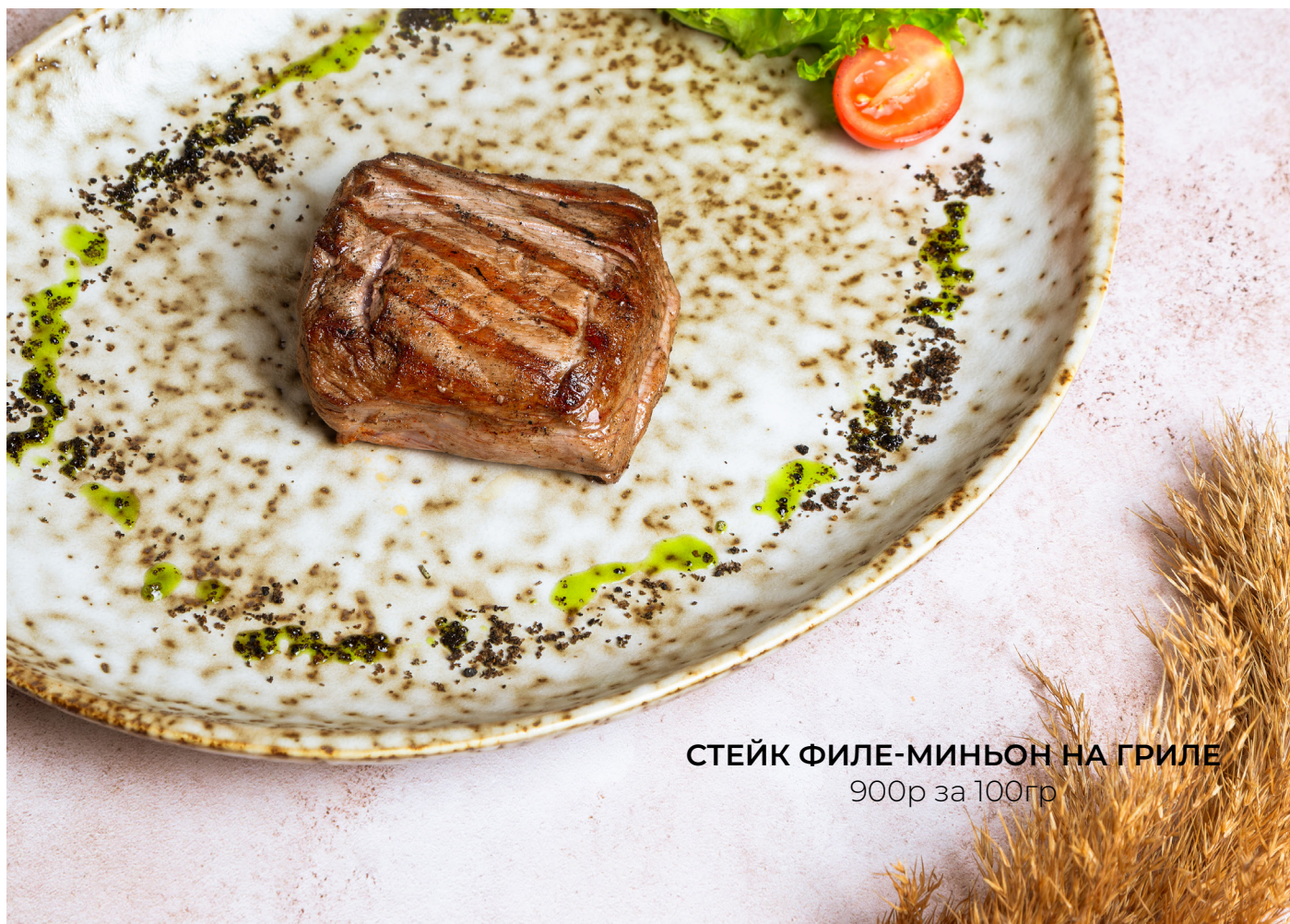
СТЕЙК ФИЛЕ-МИНЬОН НА ГРИЛЕ 900р за 100гр