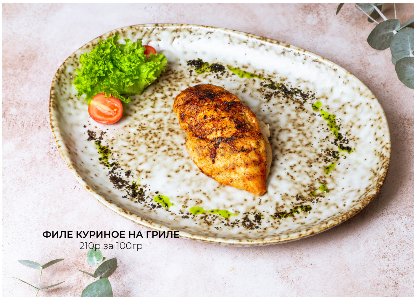
ФИЛЕ КУРИНОЕ НА ГРИЛЕ 210р за 100гр