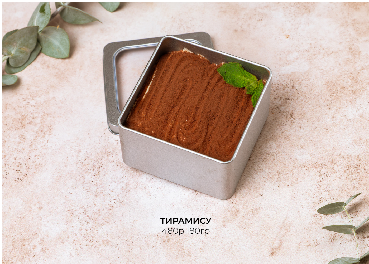
ТИРАМИСУ 480р 180гр