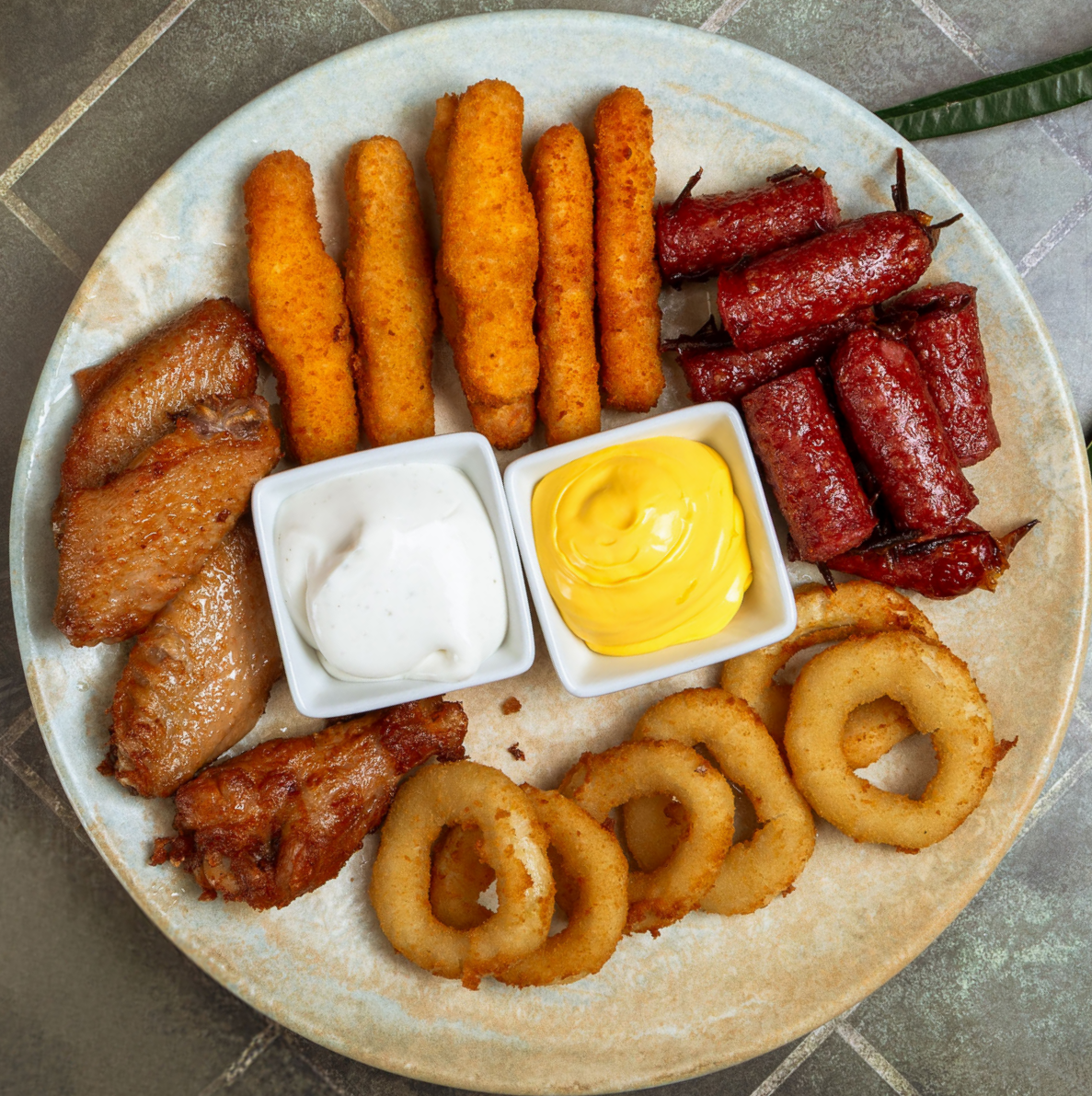
ПИВНОЙ СЕТ 1300р 400/100гр