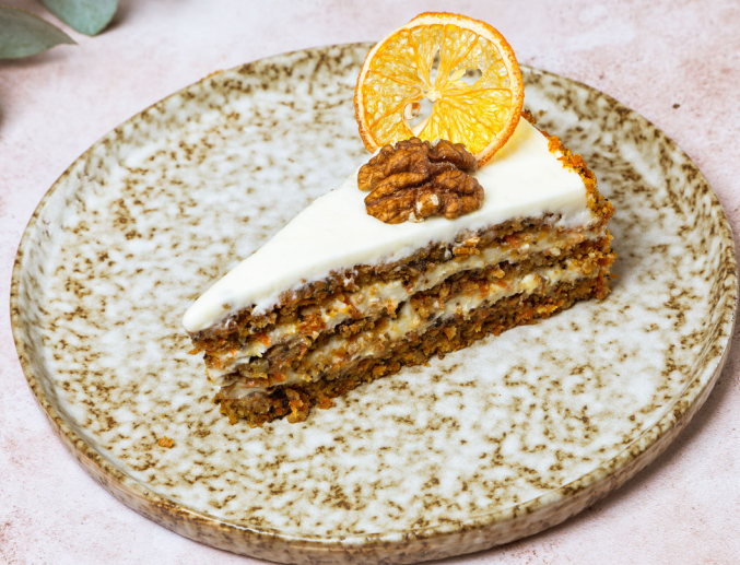
МОРКОВНЫЙ ТОРТ 420р 180/5гр