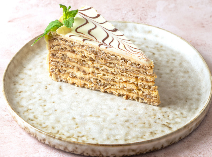
ЭСТЕРХАЗИ 420р 125гр