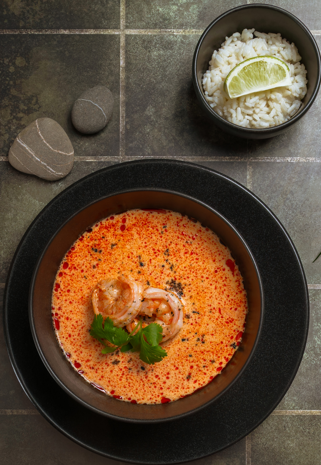
ТОМ ЯМ С МОРЕПРОДУКТАМИ 720р 360/30/10гр