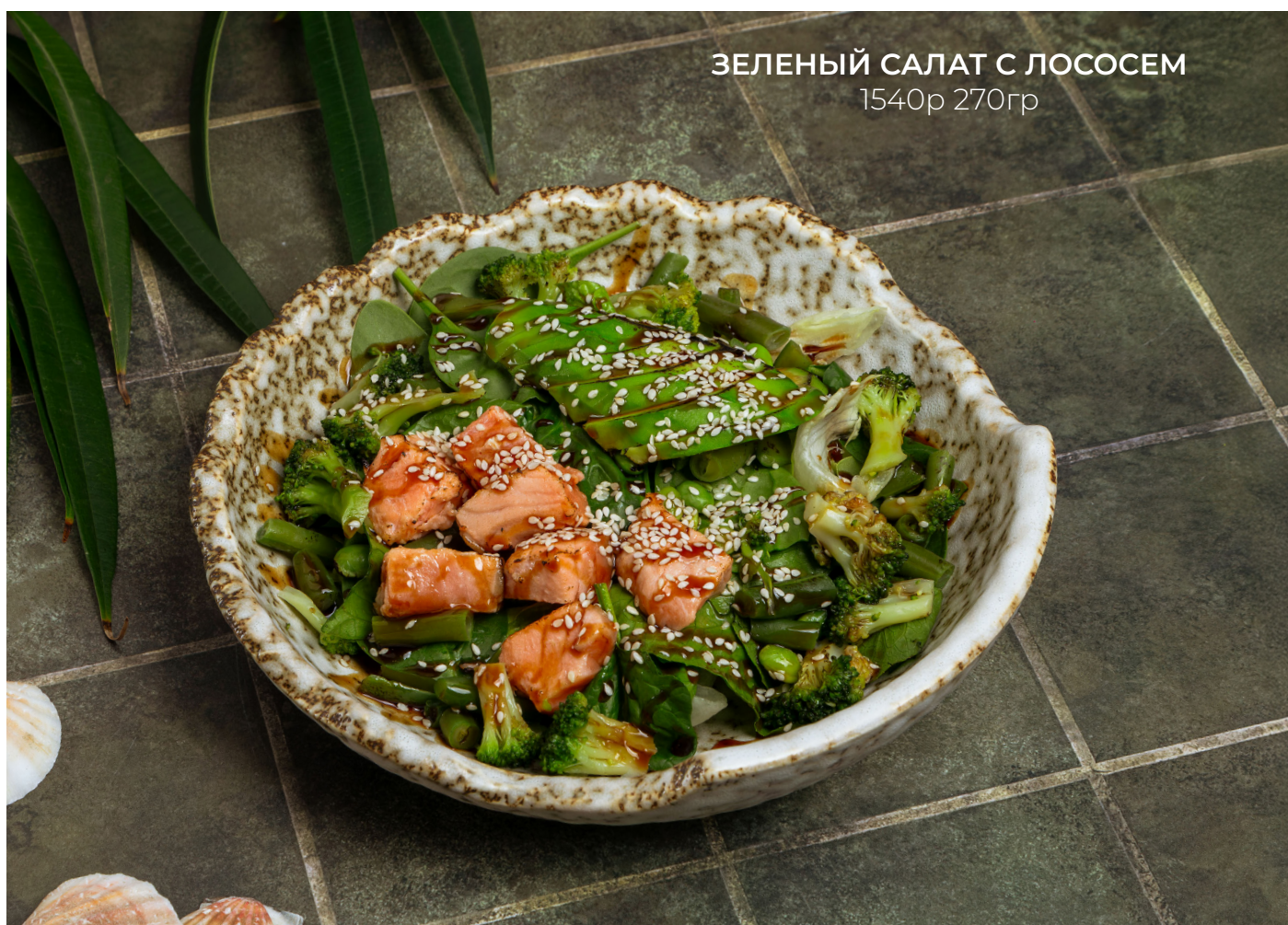
ЗЕЛЕНЬ САЛАТ С ЛОСОСЕМ 1540р 270гр