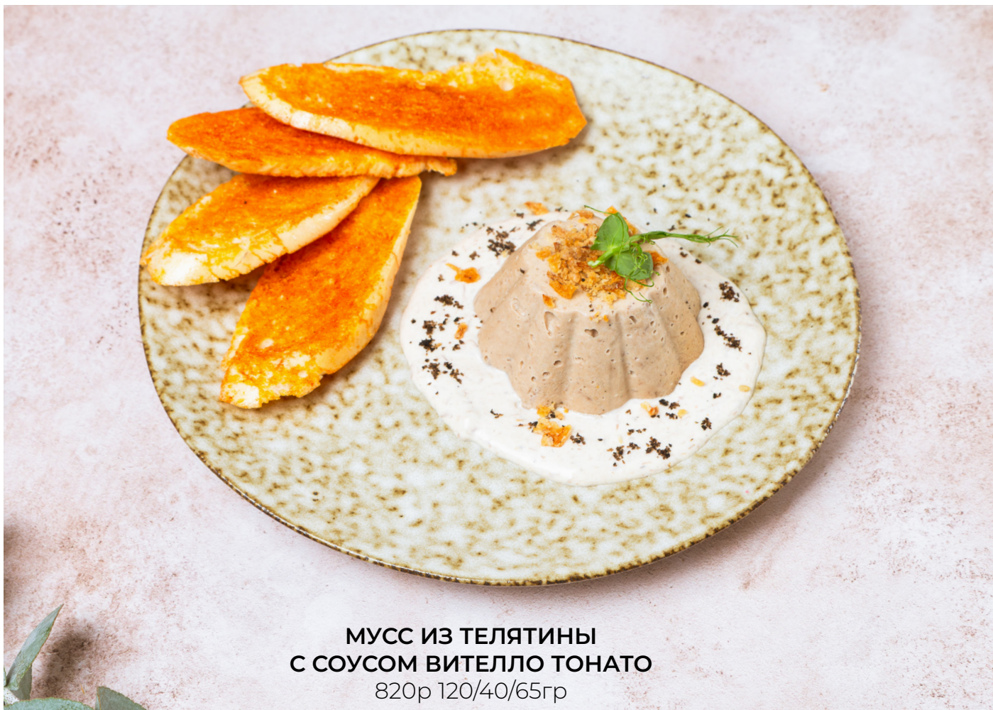
МУСС ИЗ ТЕЛЯТИНЫ С СОУСОМ ВИТЕЛЛО ТОНАТО 820р 120/40/65гр