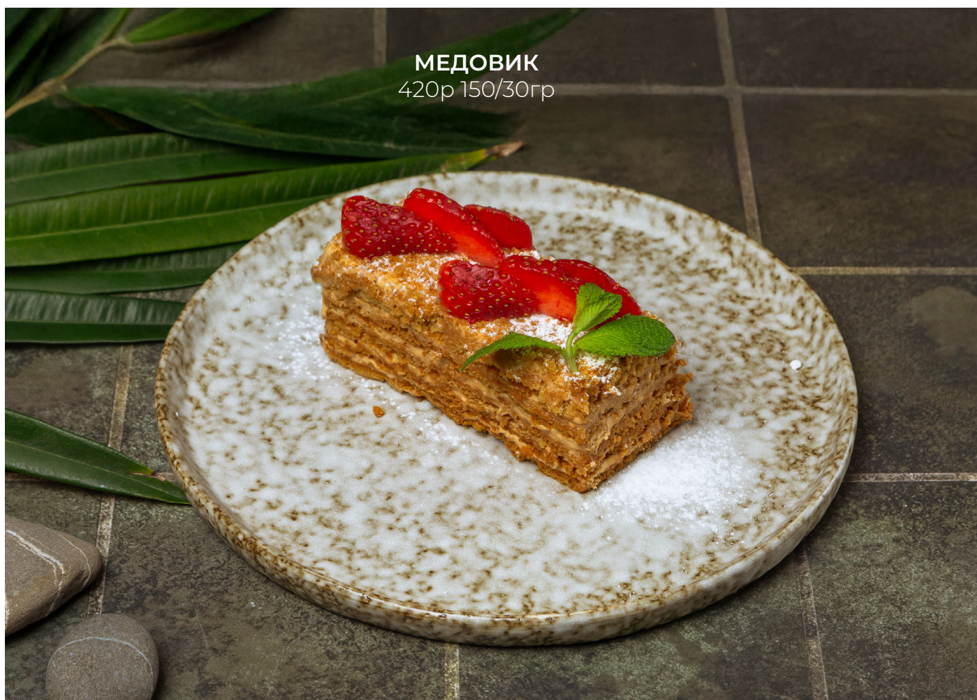
МЕДОВИК 420р 150/30гр