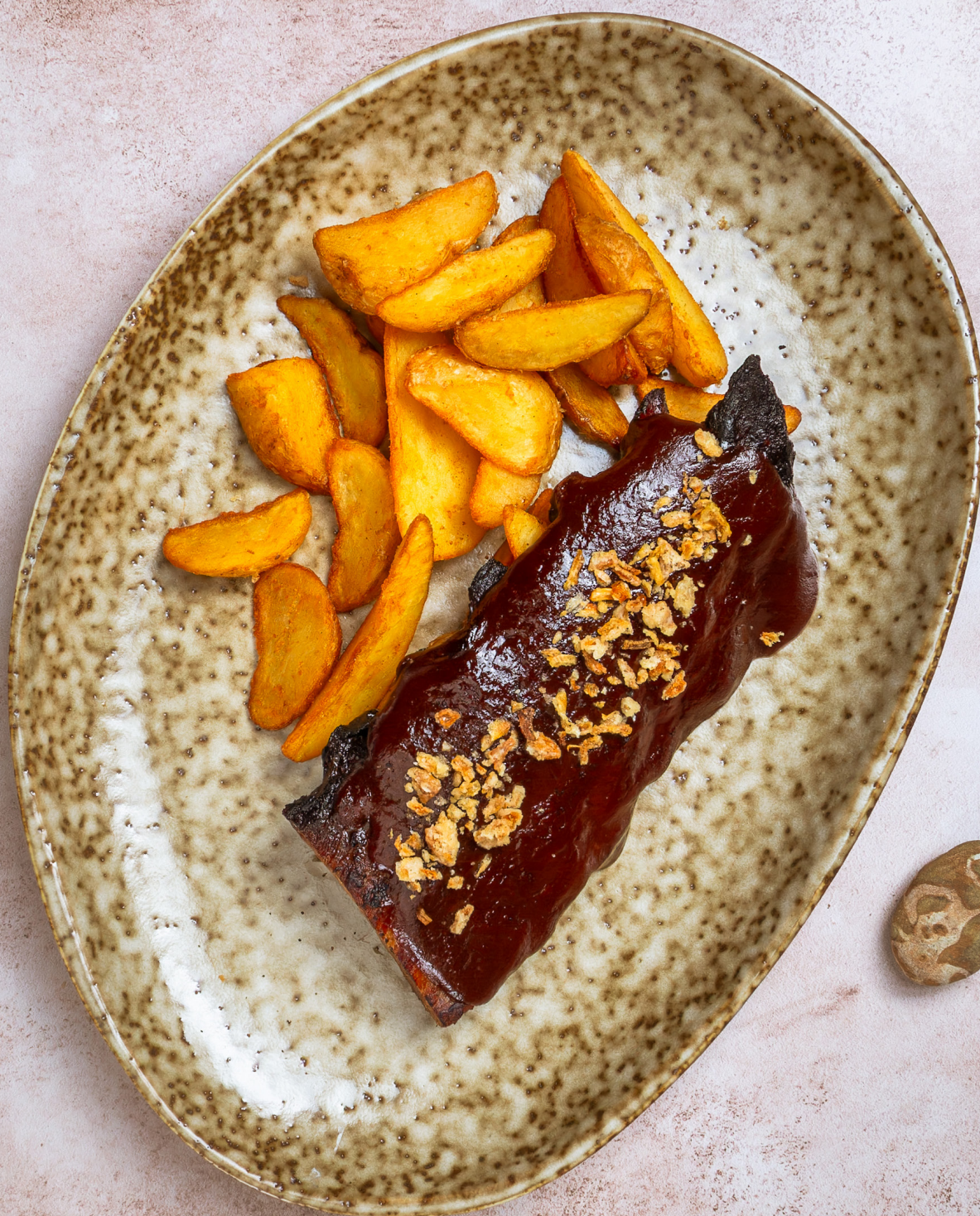
СВИНЫЕ РЕБРЫШКИ С КАРТОФЕЛЬНЫМИ ДОЛЬКАМИ 980р 250/145гр