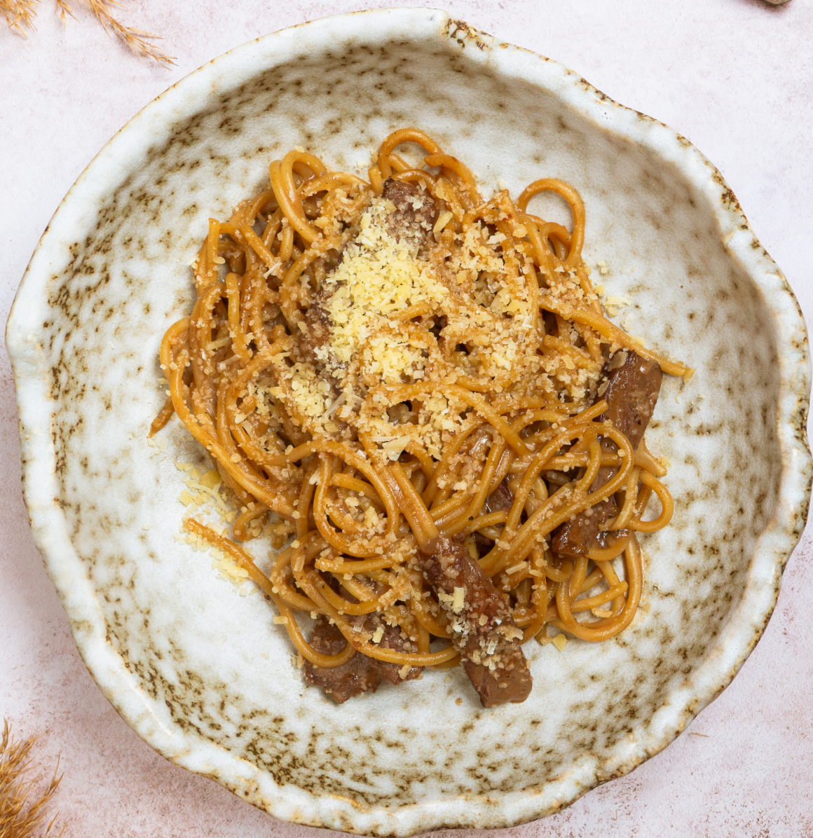
ПАСТА С ТОМЛЕННОЙ ГОВЯДИНОЙ 880р 250гр