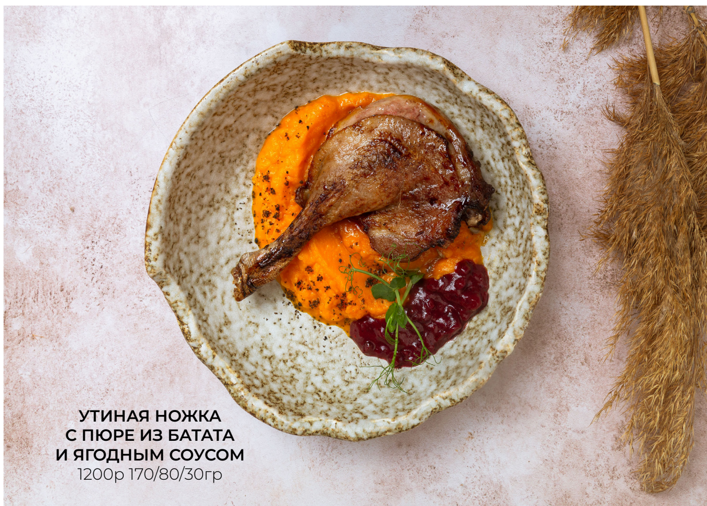
УТИНАЯ НОЖКА С ПЮРЕ ИЗ БАТАТА И ЯГОДНЫМ СОУСОМ