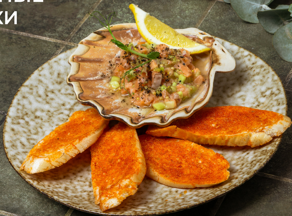
ТАРТАР ИЗ ЛОСОСЯ 690р 100/50гр