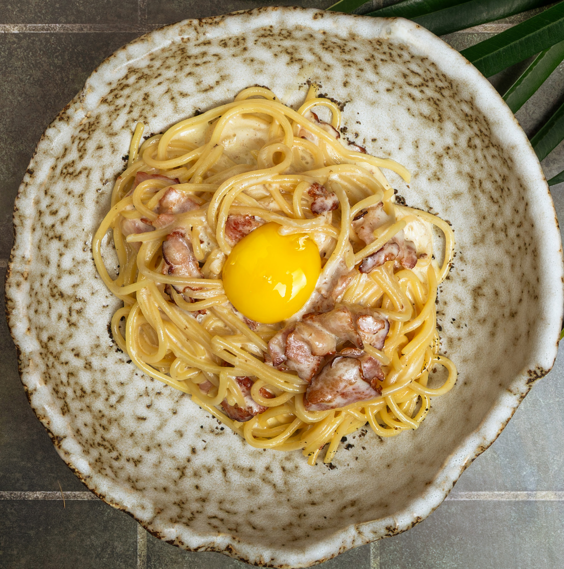
ПАСТА КАРБОНАРА 740р 250гр