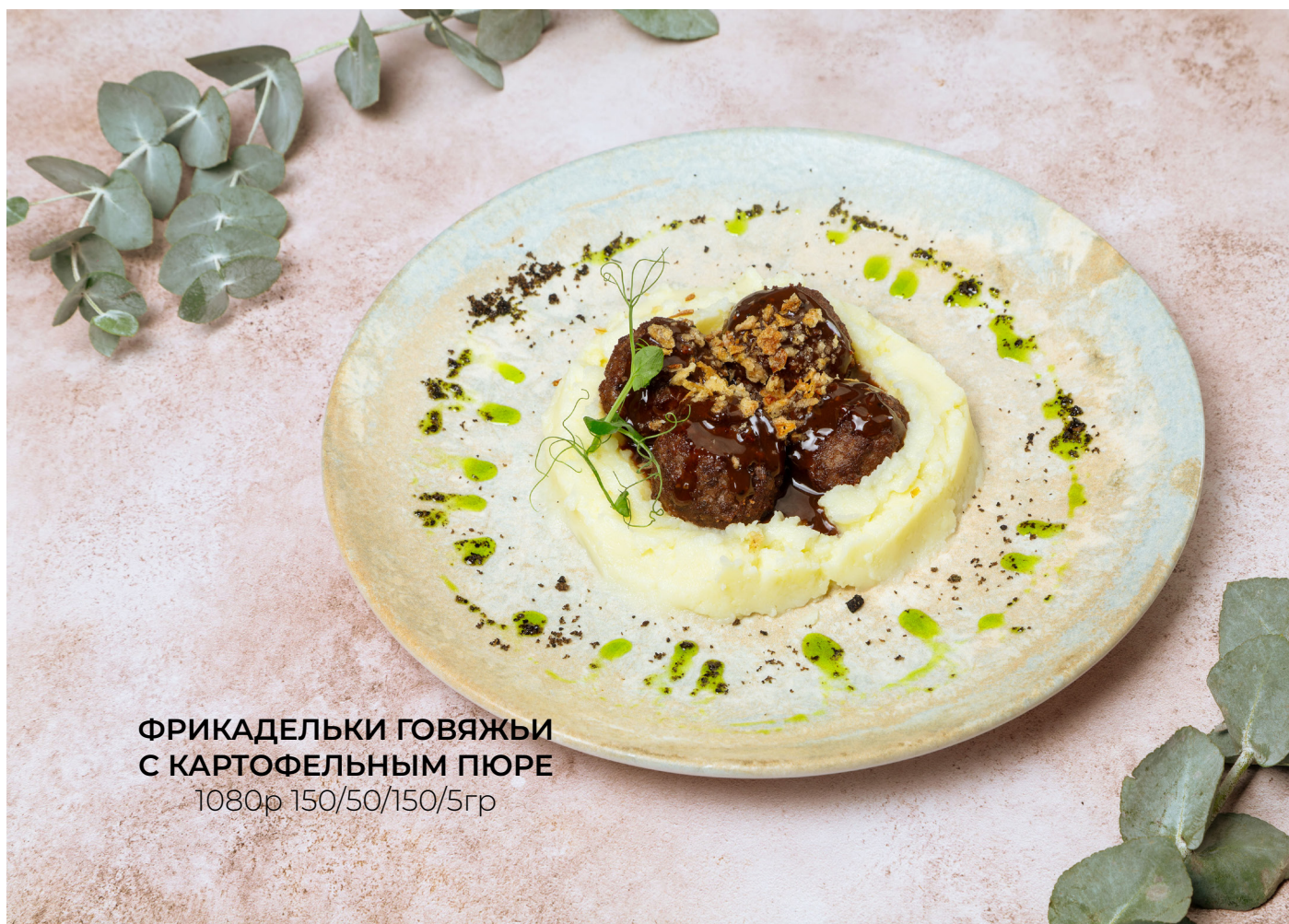
ФРИКАДЕЛЬКИ ГОВЯЖЬИ С КАРТОФЕЛЬНЫМ ПЮРЕ 1080р 150/50/150/5гр