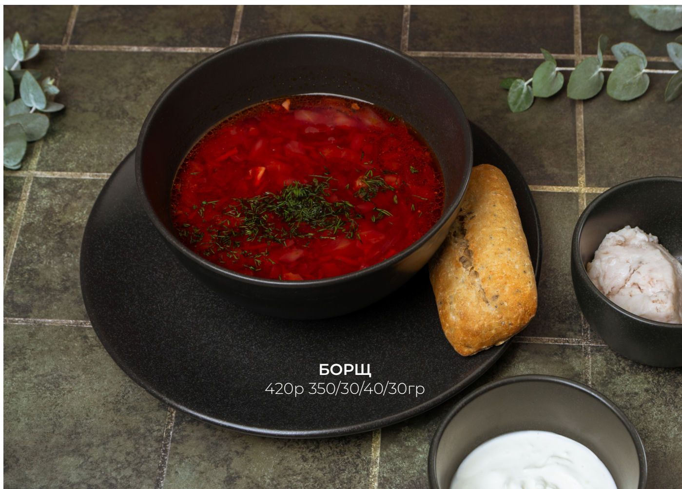
БОРЩ 420р 350/30/40/30гр