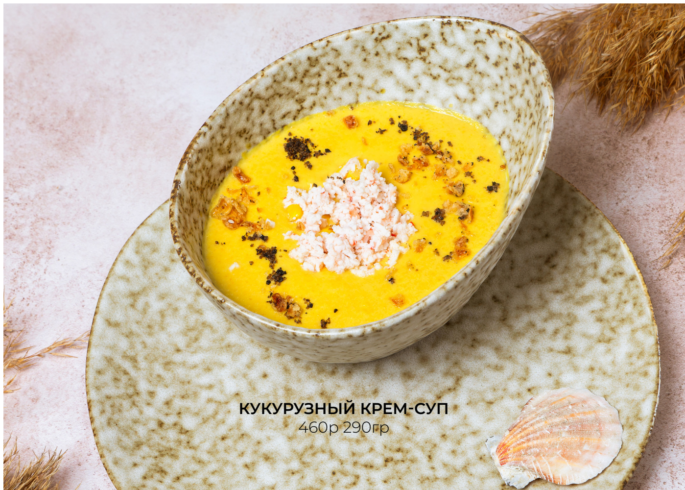
КУКУРУЗНЫЙ КРЕМ-СУП 460р 290гр