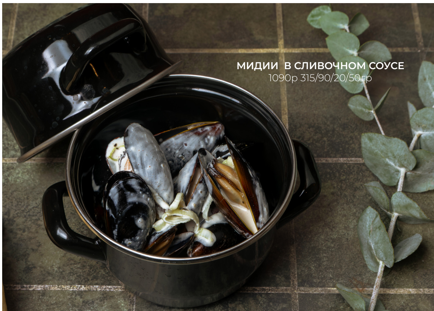
МИДИИ В СЛИВОЧНОМ СОУСЕ 1090р 315/90/20/50гр