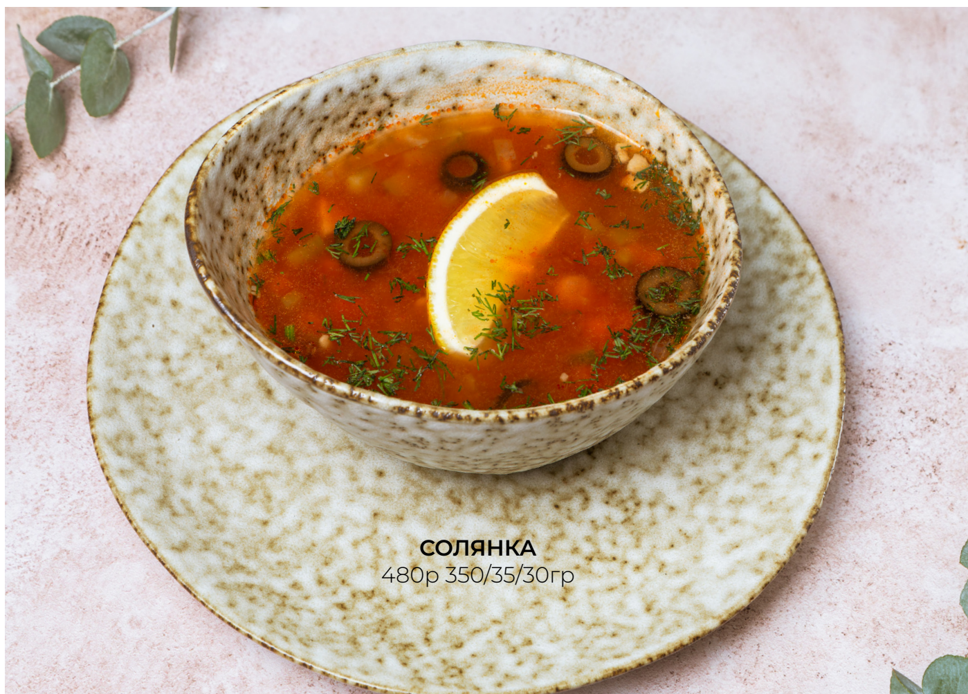
СОЛЯНКА 480р 350/35/30гр