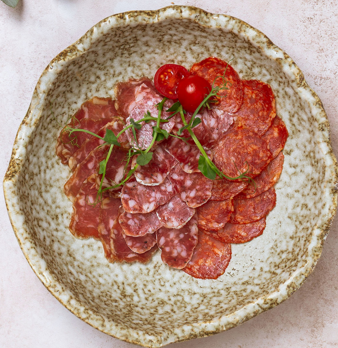
АССОРТИ ВЯЛЕНОГО МЯСА 720р 90/15гр