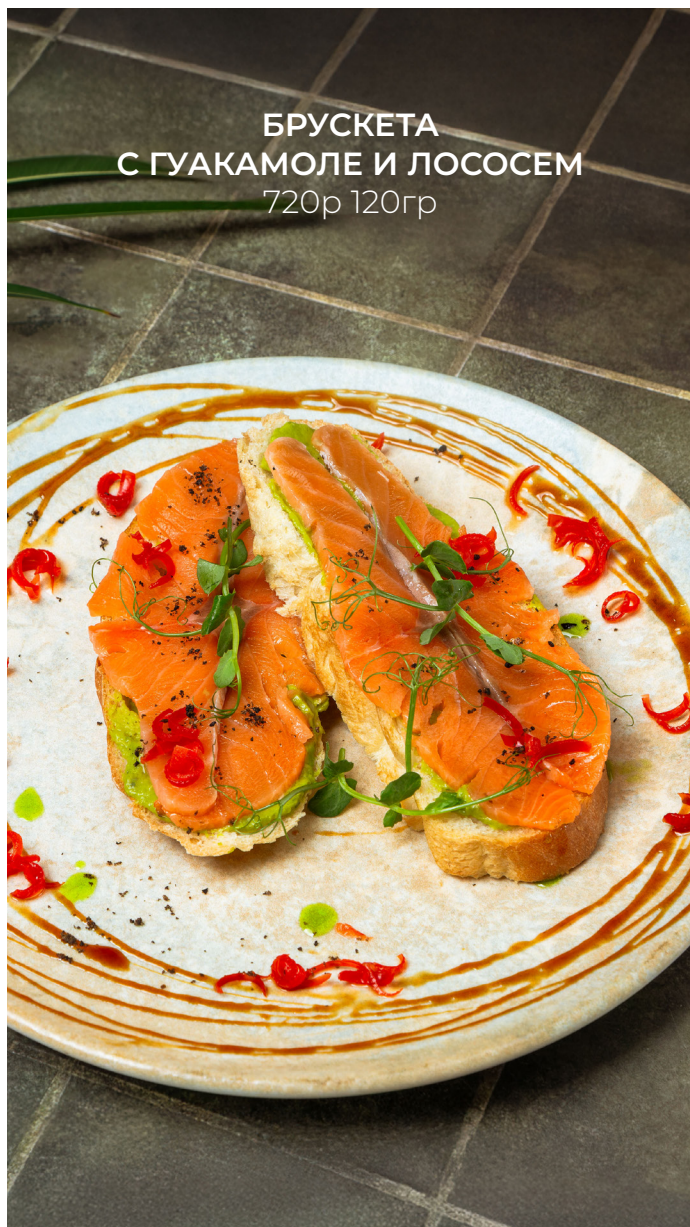
БРУСКЕТА С ГУАКАМОЛЕ И ЛОСОСЕМ 720р 120гр