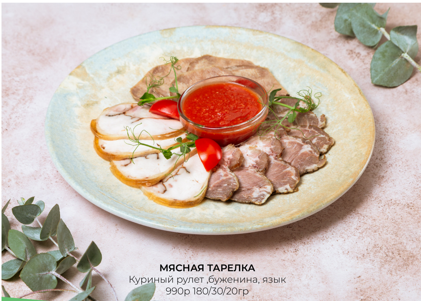
МЯСНАЯ ТАРЕЛКА Куриный рулет, буженина, язык 990р 180/30/20гр