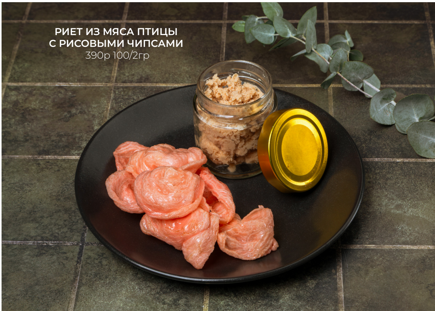
РИЕТ ИЗ МЯСА ПТИЦЫ С РИСОВЫМИ ЧИПСАМИ 390р 100/2гр