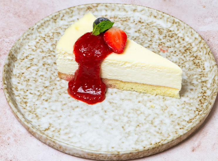
ЧИЗКЕЙК С КЛУБНИЧНЫМ МУССОМ 420р 130/20/15гр