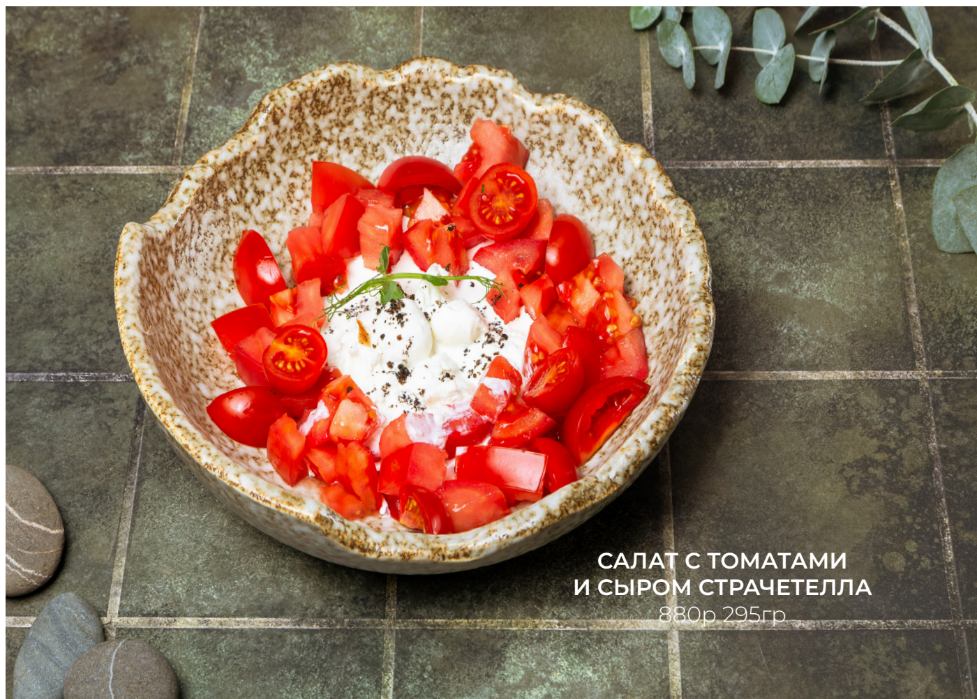
САЛАТ С ТОМАТАМИ И СЫРОМ СТРАЧЕТЕЛЛА 880р 295гр